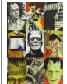
Frankenstein. A Cultural History (2007) door Susan Tyler Hitchcock.