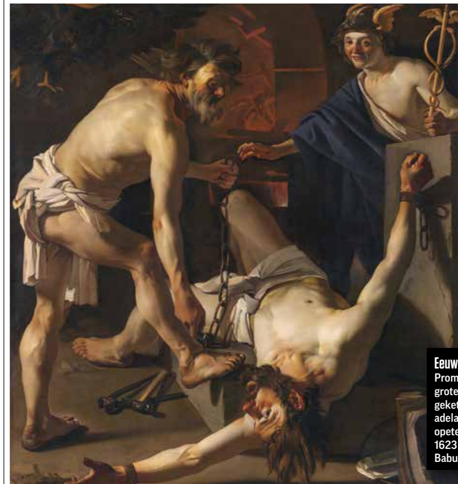
Eeuwige kwelling Prometheus wordt aan grote steenblokken geketend, zodat de adelaar zijn lever kan opeten. Schilderij uit 1623 door Dirck van Baburen.