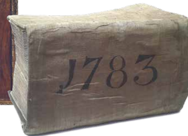
ZWARE KOST BOEKHOUDBOEK VAN DE WISSELBANK UIT 1783

delijk waren voor de grote kredieten die onder hun leiding waren verstrekt. Zij wilden dat deze oud-bestuurders – en als ze overleden waren, hun erfgenamen – uit eigen zak de tekorten vereffenden. Een officiële commissie onderzocht dit voorstel en kwam tot de conclusie dat het onbillijk en onuitvoerbaar was. De regenten hadden misschien wel onvoorzichtig, maar niet misdadig gehandeld. De kredietverlening aan de voc was in strijd met de voorschriften, maar het was ook een oude traditie. De aansprakelijkstelling zou dan een paar generaties terug moeten gaan en dat was niet te doen. Uiteindelijk werd besloten tot een gedwongen lening die moest worden opgebracht door de 55 rijkste ingezetenen van de stad. Deze protesteerden hevig, maar tevergeefs. Ze moesten gewoon betalen. Gelukkig voor hen werd met steun van het Staatsbewind geld bijeengeschraapt waarmee de lening al snel weer werd afgelost. En in 1802 was het bankgeld weer geheel gedekt door