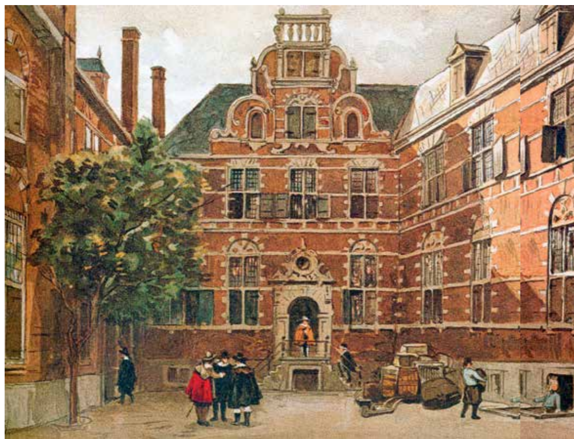
ONS KENT ONS SOMMIGE COMMISSARISSEN VAN DE WISSELBANK HEBBEN ZAKELIJKE BANDEN MET DE VOC Oost-Indisch Huis.

In bestuurlijke kringen werd naarstig naar een oplossing gezocht vanwege het vermeende belang van de onderneming voor de nationale economie. De Staten-Generaal stelden voor dat de Wisselbank het benodigde geld zou verschaffen en de burgemeesters zetten de commissarissen onder druk daarmee in te stemmen. Zo kwam het dat de bank de kwakkelende Compagnie in 1780 een voorschot verleende van 2,6 miljoen gulden, een jaar later van 5,1 miljoen en in 1783 van nog eens ruim 2 miljoen gulden. De jaren