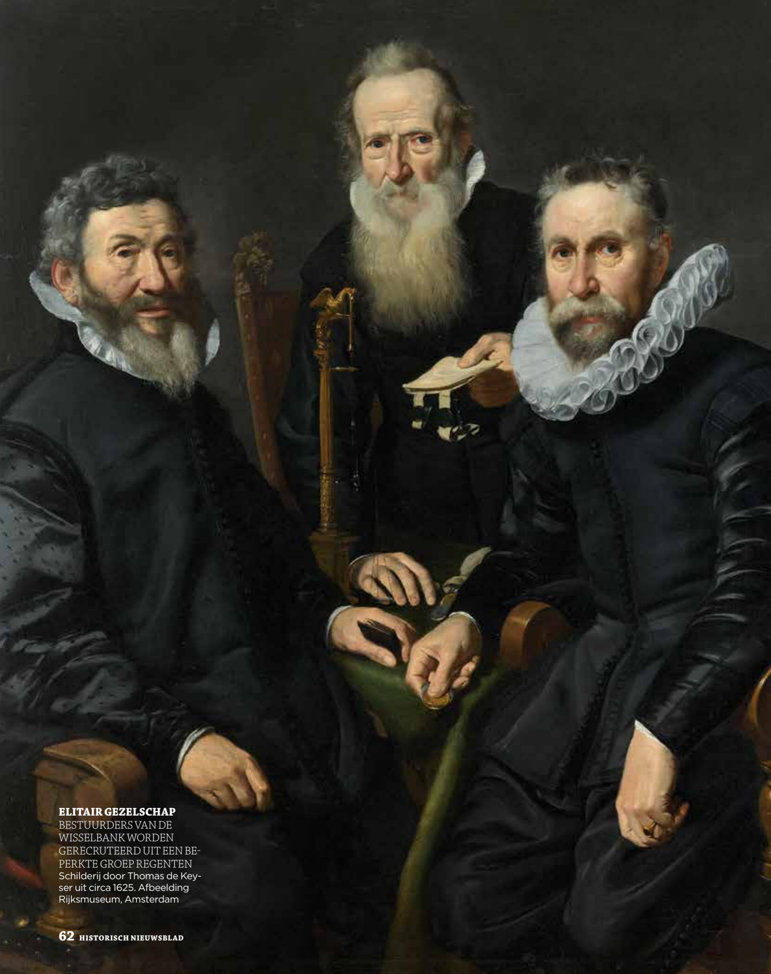
ELITAIR GEZELSCHAP BESTUURDERS VAN DE WISSELBANK WORDEN GERECRUTEERD UIT EEN BE- PERKTE GROEP REGENTEN Schilderij door Thomas de Key- ser uit circa 1625.