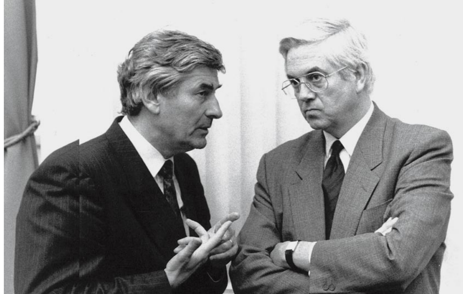
Onderonsje Lubbers overlegt met de fractievoorzitter van de VVD, Frits Bolkestein, 1990.

Opgetogen Lubbers wacht op de verkiezingsuitslag van 1986: mag hij zijn karwei afmaken?