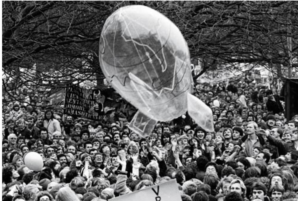
Massaal Duizenden protesteren in 1981 op het Museumplein in Amsterdam tegen de plaatsing van kernraketten.

voor de PvdA was. 'Hij trok politieke vraagstukken een technische kant uit en zijn CDA/VVD-kabinetten zochten geen consensus in sociale vraagstukken.'