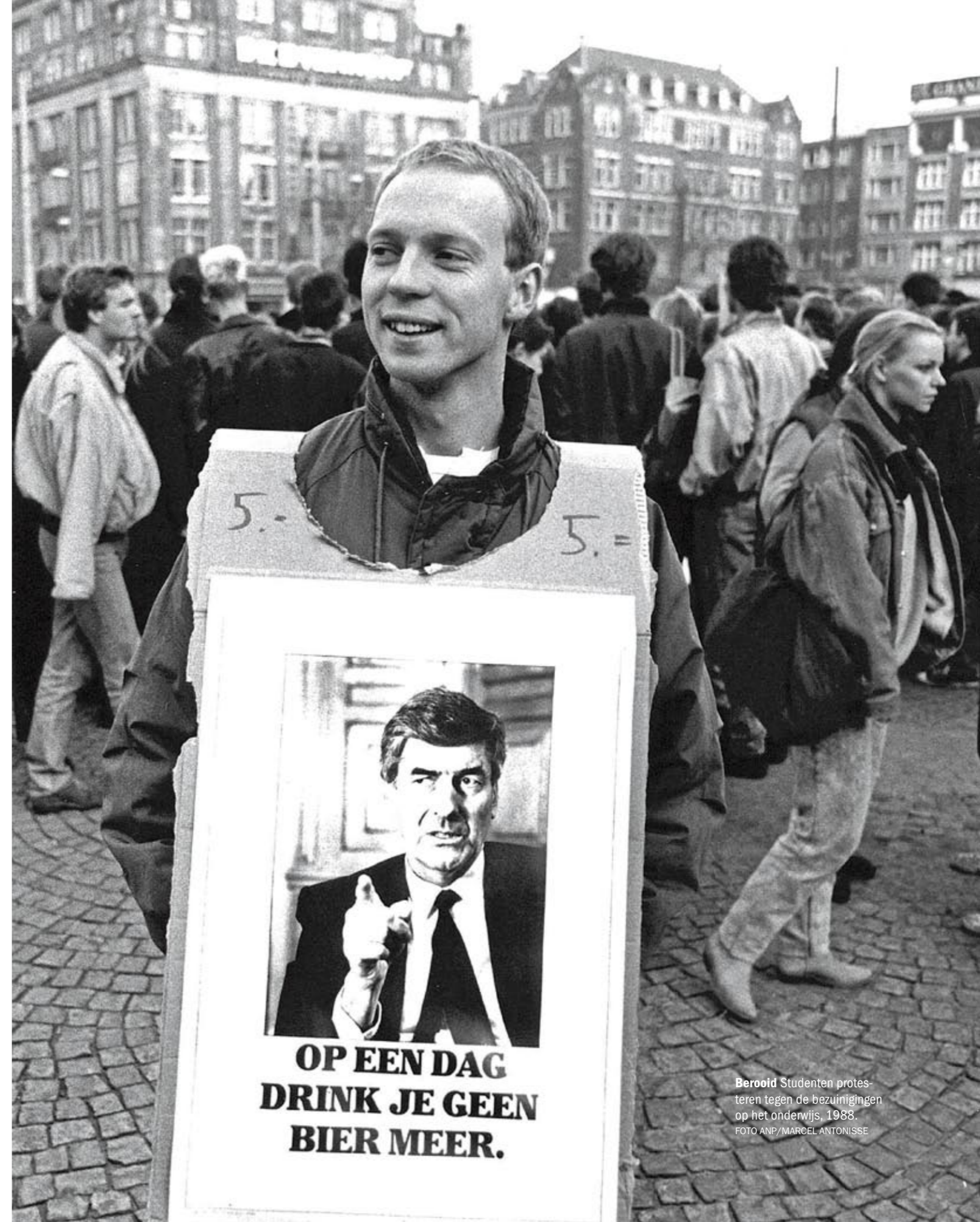
Berooid Studenten protesteren tegen de bezuinigingen op het onderwijs, 1988.

In het verkiezingsjaar 1986 bleef het kabinet bezuinigen. Volgens Lubbers moesten de kiezers weten waar ze aan toe waren. Het CDA