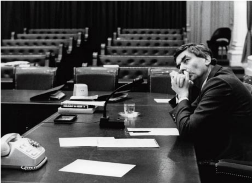
Betrokken Lubbers voor een overleg in het par- lement, 1986.

aan het vertrek van Lubbers. Hij was populairder dan zijn partij. Met 37 zetels werd de PvdA net iets groter dan het CDA. Zo ontstond het eerste paarse kabinet onder leiding van Wim Kok, een bewuste poging van PvdA, VVD en D66 om zonder het CDA te regeren.